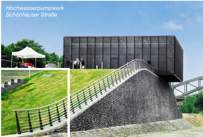
Hochwasserpumpwerk Schönhauser Straße