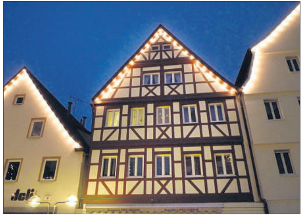
Dass im ehemaligen „Vogthaus“ am Waiblinger Marktplatz einmal die Gebeine der Heiligen Drei Könige für eine Nacht ruhten, ist eine Legende. Vielleicht. Vielleicht auch nicht.

Und was ist aus dem „Vogthaus“ geworden? 1730 wurde es durch Tausch in das Gebäude Kurze Straße 26 verlegt, erläutert der frühere Stadtarchivar Wilhelm Glässner in seinem „Führer durch die Altstadt“, und war dann gegenüber der Rathaus-Apotheke untergebracht. Von 1930 bis 1958 war dort das Land-