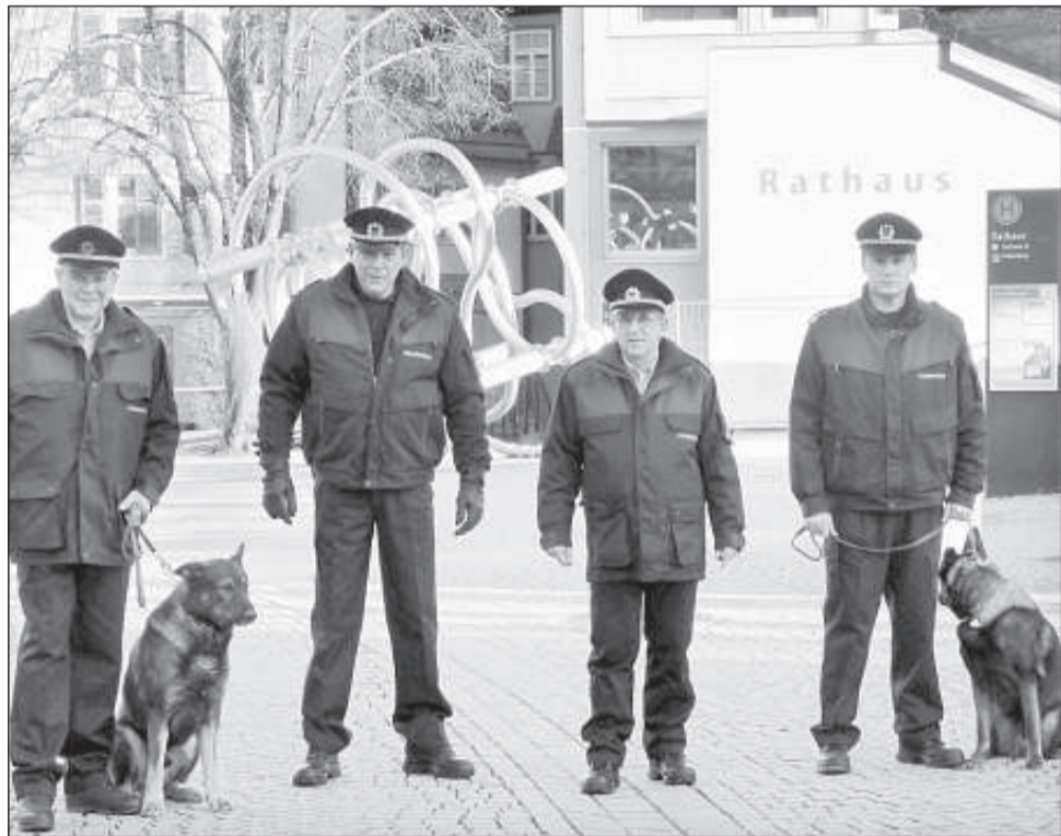
Diese vier Männer sind künftig im Auftrag der Sicherheit für die Waiblinger Bevölkerung unterwegs. Unterstützt werden sie von den beiden Hunden Lobo und Miki. Der neue Kommunale Ordnungsdienst hat sich am Dienstag, 3. Januar 2012, der Presse vorgestellt.

Und weil die „Beamten“ im Notfall aktiv ins Geschehen eingreifen, müssen sie noch besser und intensiver geschult sein. Werner Nußbaum, der Leiter des Fachbereichs Bürger-